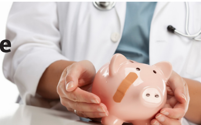
Helsedirektivet: EUs helsedirektiv gjør helse til en vare.