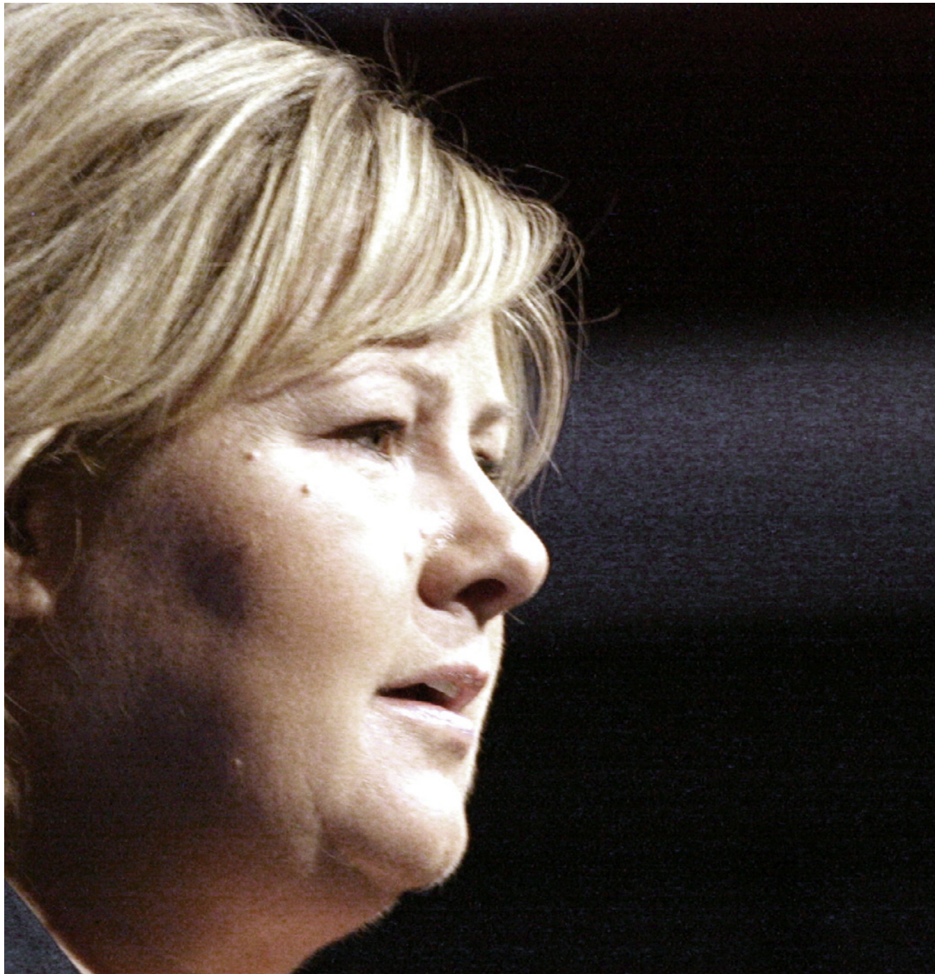
Blåmandag: Rødt-leder Bjørnar Moxnes frykter Erna Solbergs planer for den norske velferdsstaten.