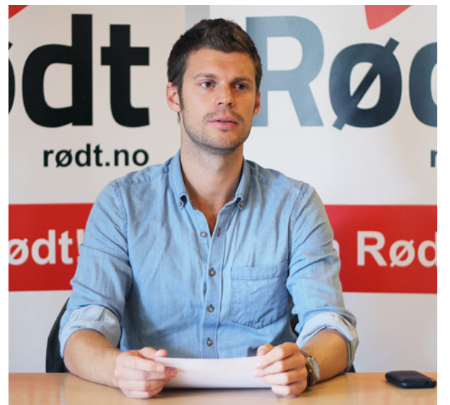
Rødt-leder: Bjørnar Moxnes.

– Norge bør foreslå en våpenembargo, et forbud mot å selge våpen til partene som kriger i Syria. Kommer man ingen vei med det, må Norge på egen hånd stoppe salg av våpen til land der det er fare