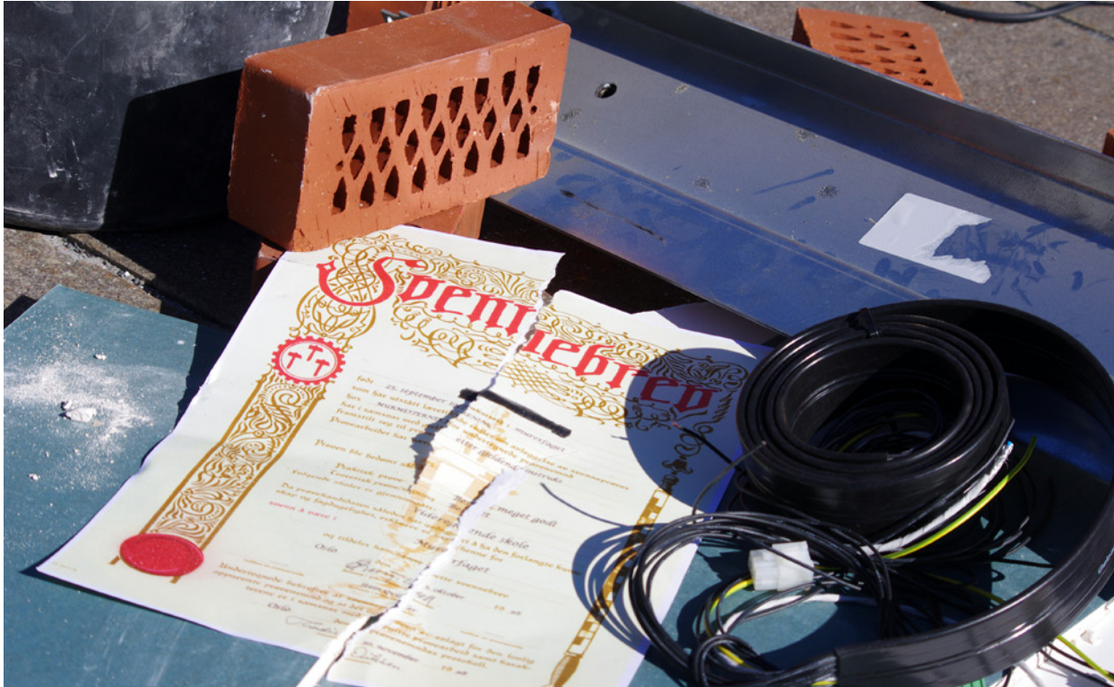
Fagbrev: Murar Eirik Kornmo átvarar unge mot å satse på muryrket.