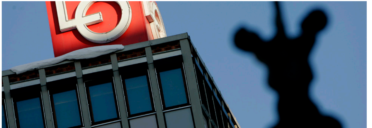
Fagbevegelsen: Ruster til kamp mot høyrepolitikk.