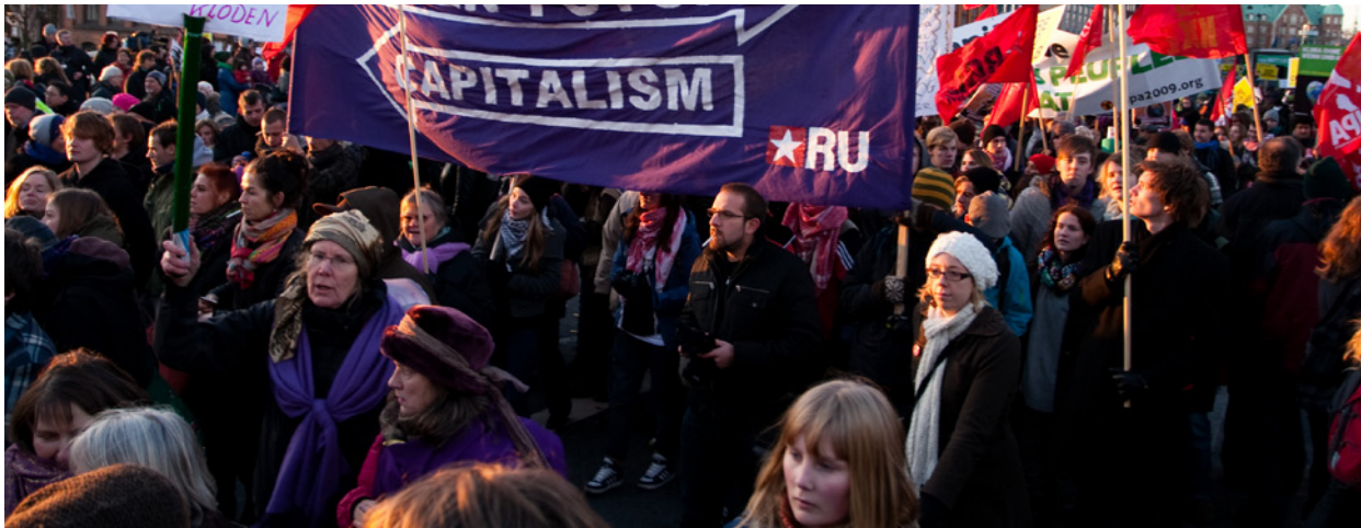
Rød Ungdom: RU er 50 år i 2013 men har blikket festa mot framtida.