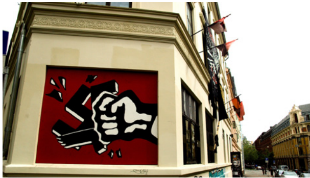
Angrepet: Blitz-huset i Oslo.