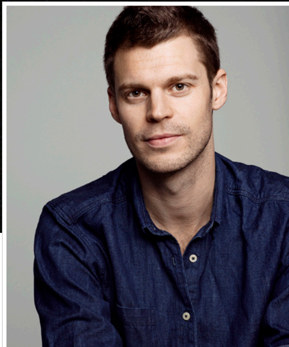
Rødt-leder: Bjørnar Moxnes.