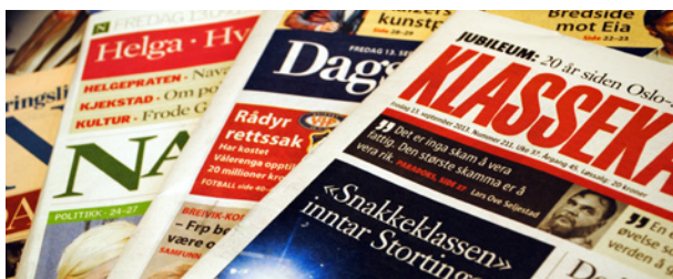
Frykter kutt: Nisjeavisene vil rammes hardt av de borgerliges kuttplaner.